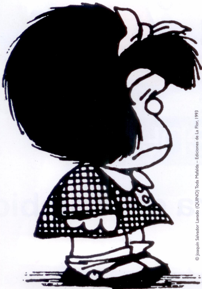
© Joaquín Salvador Lavado (QUINO) Toda Mañada - Ediciones de La Flor, 1993